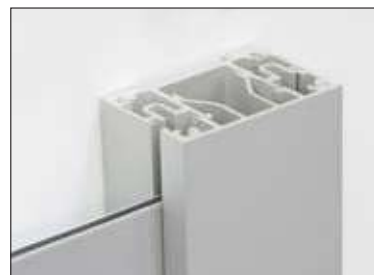
→ perfil externo