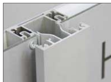
→ perfil do meio