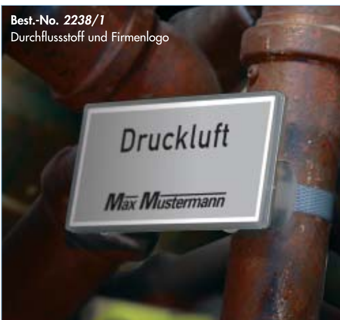
Best.-No. 2238/1 Durchflusstoff und Firmenlogo