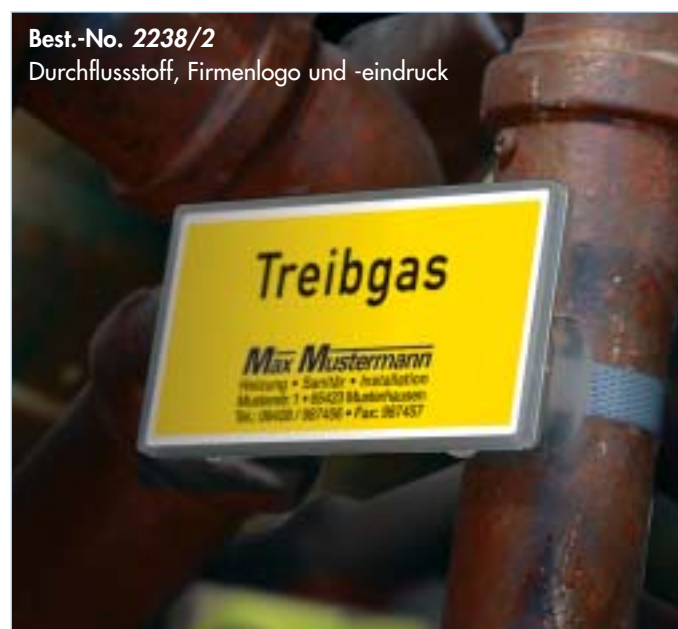
Best.-No. 2238/2 Durchflusstoff, Firmenlogo und -eindruck